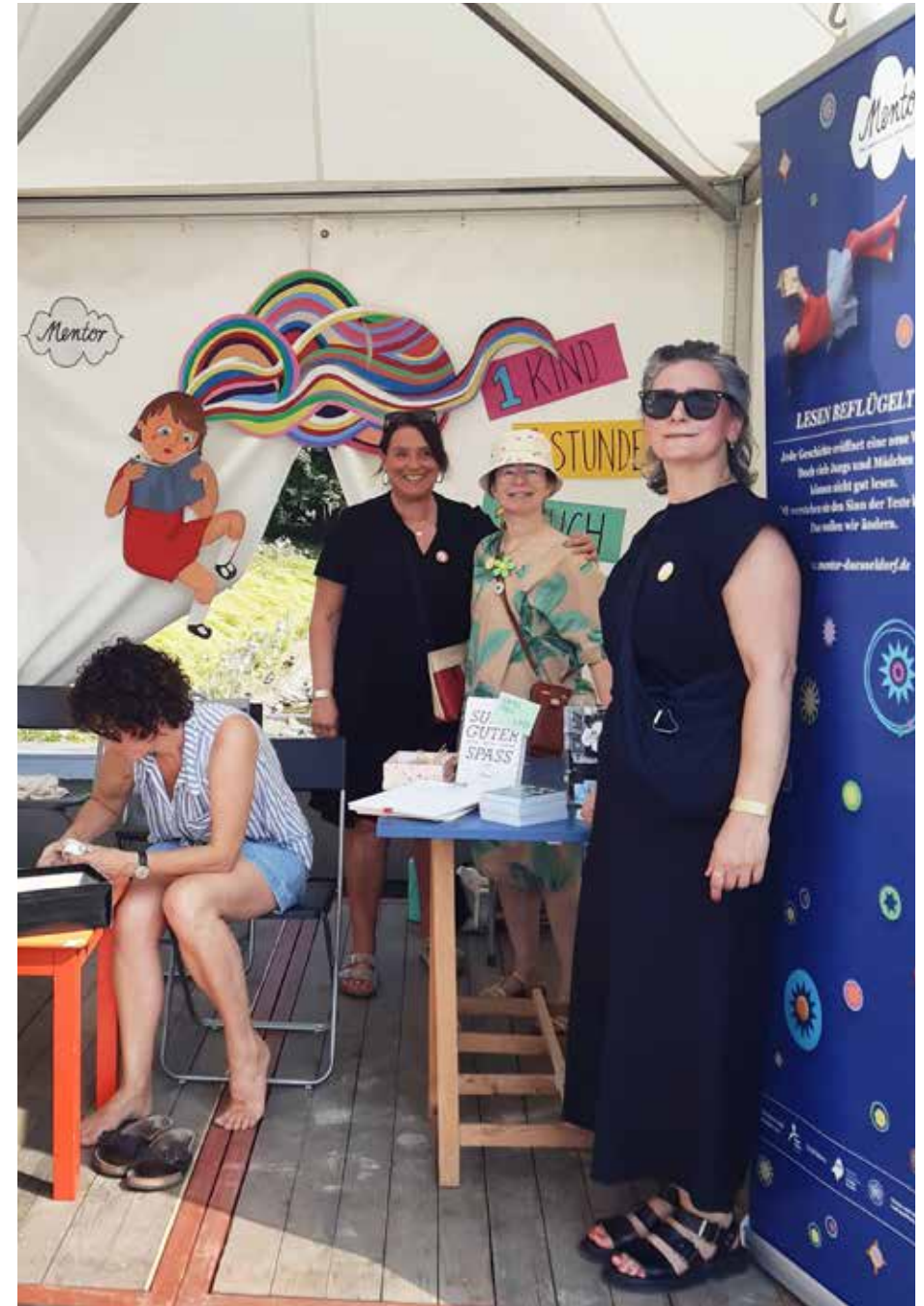
Bei schönstem Wetter präsentierten wir uns auf dem Corneliusplatz

Die Messe wurde ca. 15 Minuten vor dem offiziellen Schluss durch plötzlich eintretende Wolkenbrüche abgebrochen. Nichtsdestotrotz war es ein schöner Sonntag.